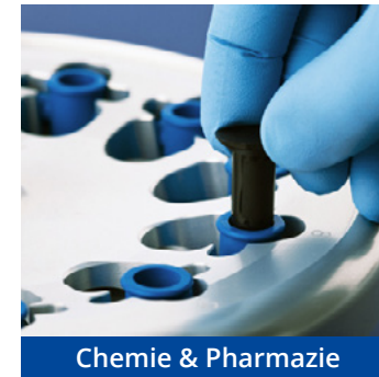
Chemie & Pharmazie