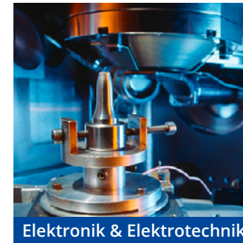
Elektronik & Elektrotechnik