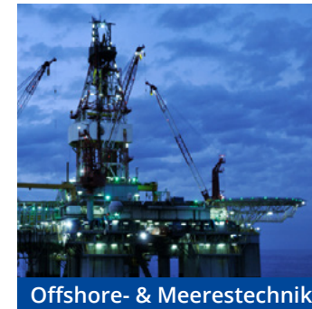
Offshore- & Meerestechnik